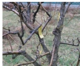
inainte de inmugurire