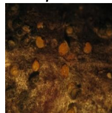
inainte de tratament