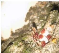
inainte de tratament

Larve hibernante - Quadraspidiotus perniciosus